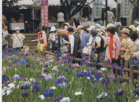
「大村公園(花菖蒲まつり)と城下町 史蹟さるく」 参加者 99名