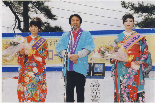
フラワー大使選彰式

大村の観光親善大使として、県内外での大村の観光PRのため1年間頑張って参ります。