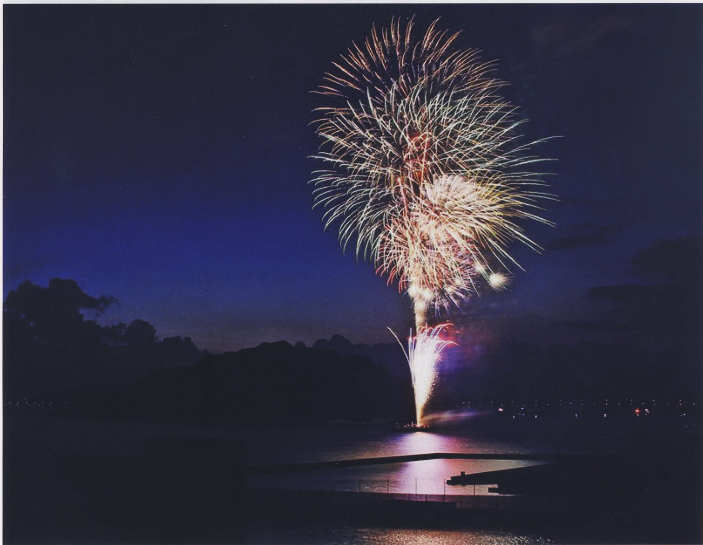
第63回おおむら夏越まつり花火大会 (井口一也氏 写真提供)