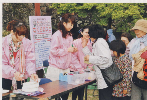
「桜まつりシュガーロード 大村すいーつバイキング」