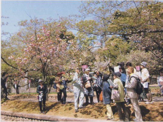
「天然記念物(おおむら桜)と石楠花まつり フラワーロード」 参加者 51名

互いの町の魅力を発見してもらうために、「長崎・諫早・大村さるく」を実施しています。 (25年度 春の実績)