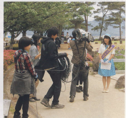
テレビでの桜・花菖蒲のPR