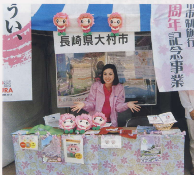
「ぐるりん観光・物産展」 新鳥栖駅にて

フラワーメイツのメンバー13名は市内外の各種イベント等へ参加し大村の観光PRの一翼を担っています。