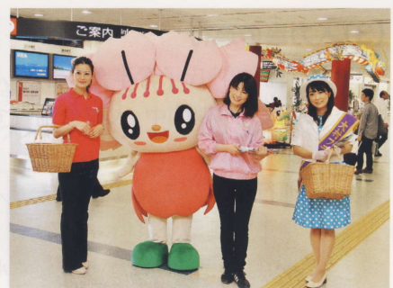
「長崎空港での花まつりPR」