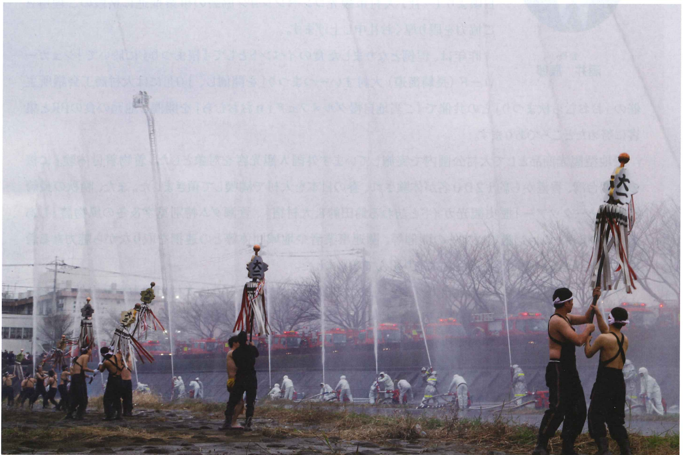
写真(出初式 大上戸川からの放水)