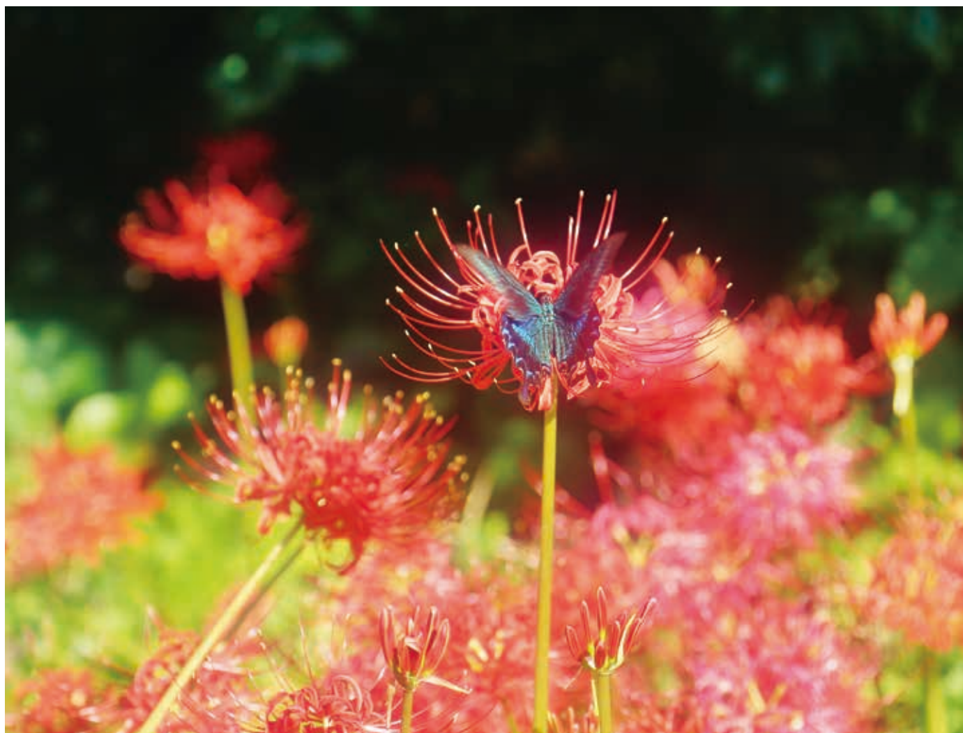
「鉢巻山ひがん花」