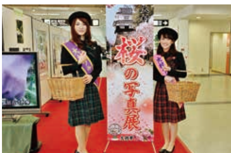
(長崎空港での花まつりPR)