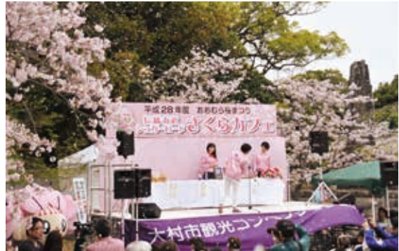
「桜まつり」への参画