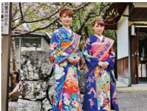
フラワー大使選彰式(大村神社)