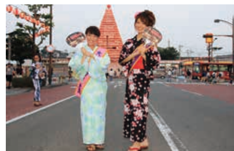
(おおむら夏越花火大会)