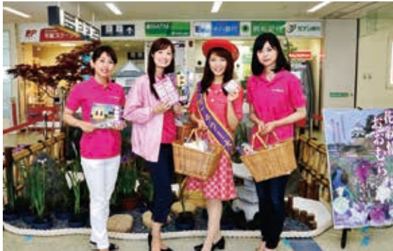
長崎空港での「花まつり」PR

フラワーメイツのメンバー17名は市内外の各種イベント等へ参加し大村の観光PRの一翼を担っています。