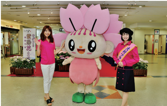
(長崎空港での花まつりPR)

フラワーメイツのメンバー18名は市内外の各種イベント等へ参加し大村の観光PRの一翼を担っています。