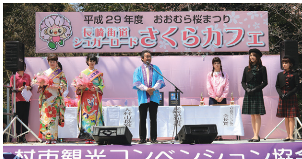
フラワー大使選彰式

大村の観光親善大使として、県内外での大村の観光PRのため1年間頑張ってください。