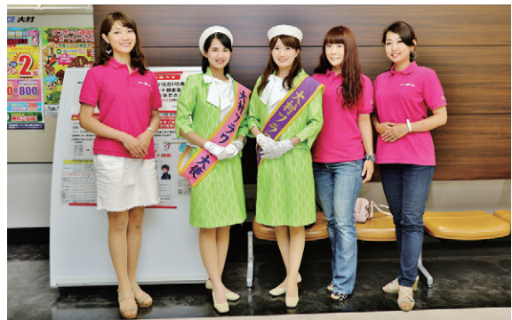
(花火大会への参画)