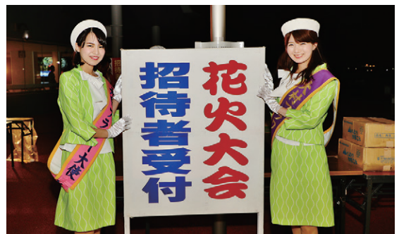
(おおむら夏越花火大会)