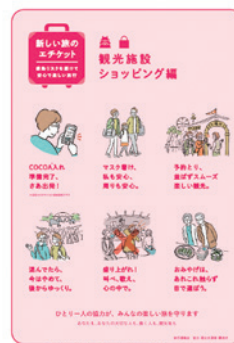
観光施設 ショッピング編