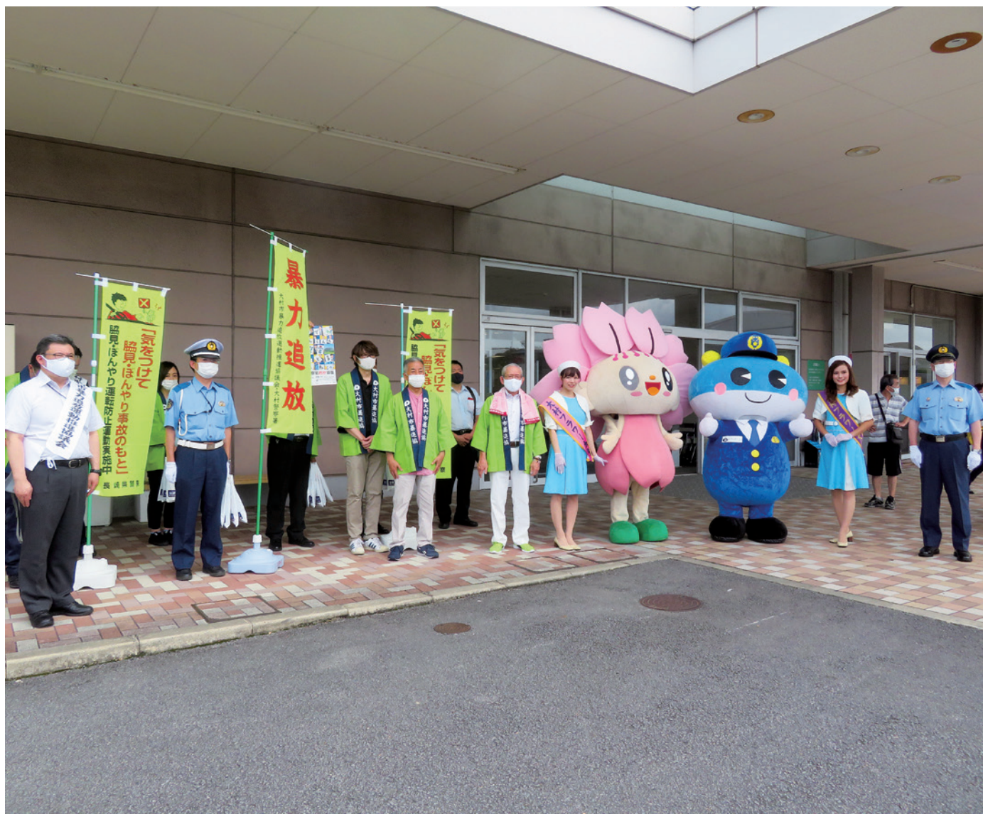
暴排キャンペーン(イオン大村)