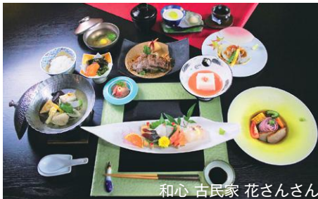
和心 古民家 花さんさん