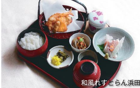
和風れすとらん浜田