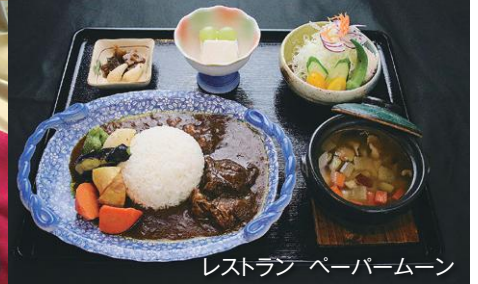
レストラン ペーバムーン