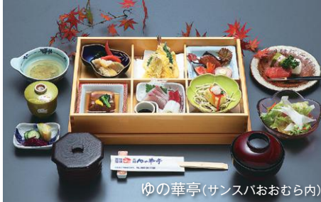
ゆの華亭(サンパおおむら内)