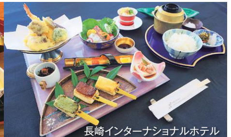
長崎インターナショナルホテル