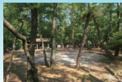
⑩玖島崎キャンプ場