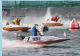
①ボートレース大村