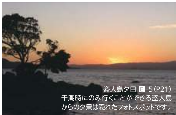
盗人島夕日 E-5 (P21) 干潮時にのみ行くことができる盗人島 からの夕景は隠れたフォトスポットです。