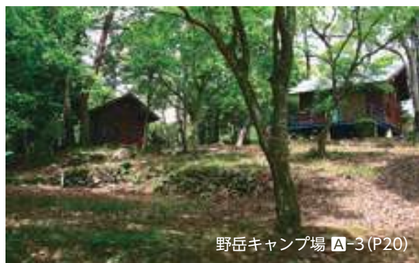
野岳キャンプ場 A-3 (P20)

元氣工房 E-3 (P21) 住所: 〒856-084 長崎県大村市日泊町1544-1 電話番号: 0957-52-7321