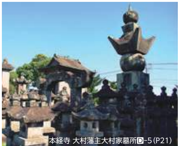
本経寺 大村藩主大村家墓所 ㊦-5(P21)

境内には、本堂や山門など江戸時代後期の建造物が残り、江戸時代の大名の菩提寺の様子を伝えています。