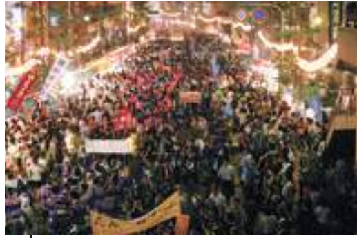
8月2,3日 おおむら夏越祭り