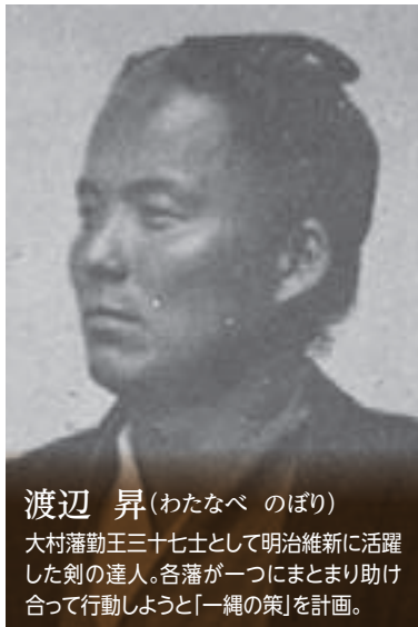
渡辺 昇 (わたなべ のぼり)

西郷隆盛と勝海舟とで行われた江戸城無血開城の会談に立ち会い、新政府では福岡県令や福島県知事として活躍。