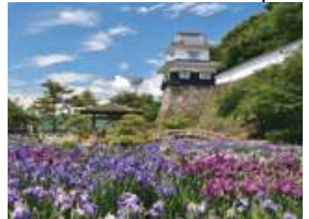
5月下旬～6月上旬 (期間中1回) 花菖蒲まつり