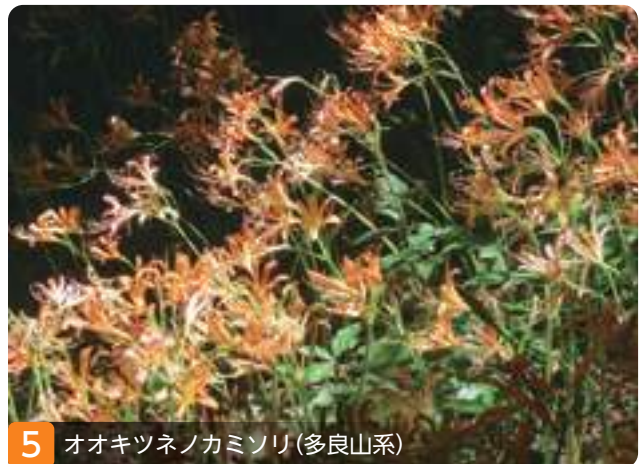
5 オオキツネノカミソリ(多良山系)