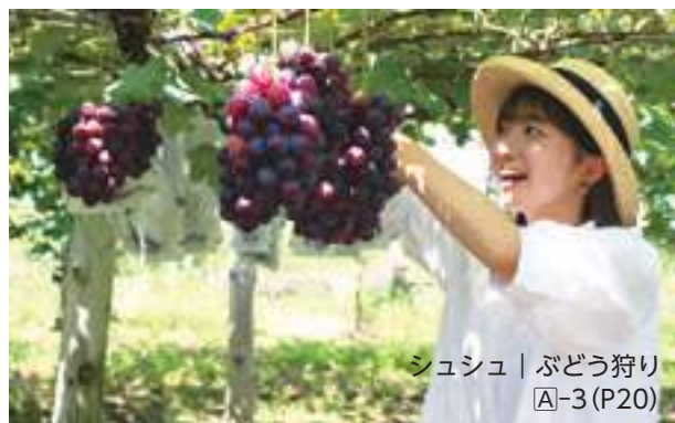
シュシュ | ぶどう狩り A-3 (P20)