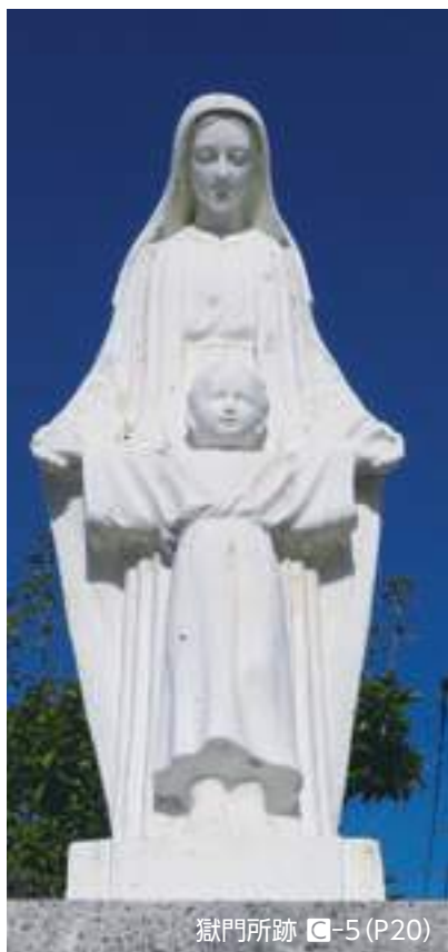
獄門所跡 ㊦-5 (P20)