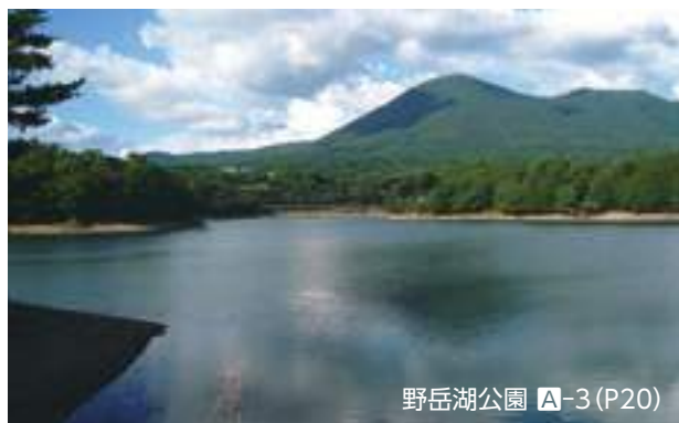
野岳湖公園 A-3 (P20)