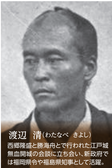
渡辺 清 (わたなべ きよし)

西郷隆盛と勝海舟とで行われた江戸城無血開城の会談に立ち会い、新政府では福岡県令や福島県知事として活躍。