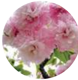
市の花 オオムラザクラ

八重桜を二つに重ねたかっこうの独特の二段咲きをして、花の外側にあるがく片の数は、10枚(普通の桜は5枚)で、花卉の総数は、少ないもので60枚、多いものでは200枚にも達するなどの特徴があり、ピンク色の優美なことでも有名です。昭和47年4月8日に市の花として決定しました。