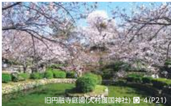
旧円融寺庭園(大村護国神社) ㊦-4(P21)