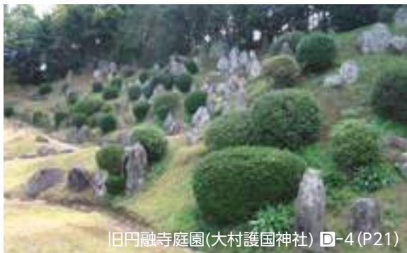
旧円融寺庭園(大村護国神社) ㊦-4(P21)

草場というのは、この付近の古い地名であり、その名をとって草場小路と呼ばれました。また袋小路とも呼ばれました。春日神社前から袋町、片町に至るまで、2町25間2尺3寸(約260メートル)あり、岩永家や長与家など5戸の屋敷しかありませんでしたが、円融寺があり、大村の武家屋敷街の特徴である見事な五色塀が残る通りです。