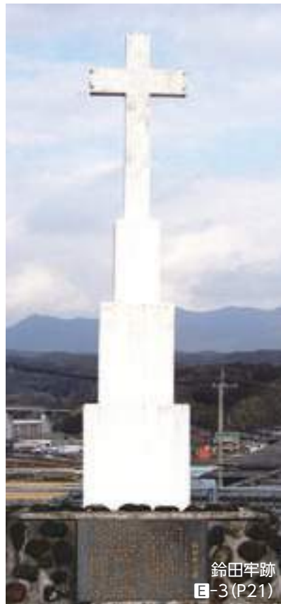
鈴田牢跡 ㊦-3 (P21)