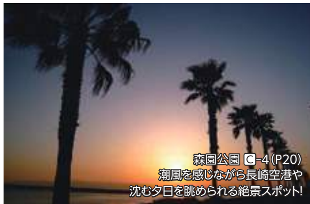
森園公園 C-4 (P20) 潮風を感じながら長崎空港や 沈む夕日を眺められる絶景スポット!