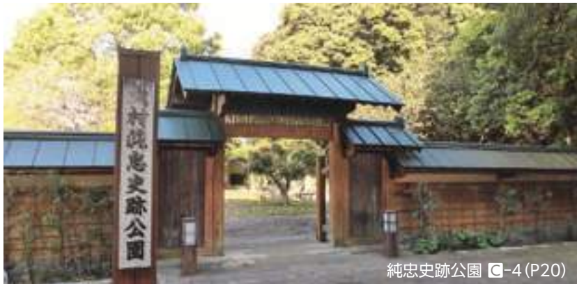
純忠史跡公園 ㊦-4 (P20)