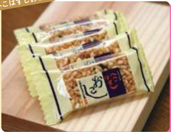
米を蒸し乾燥させたものを煎り、自家製の水飴をまぶし黒砂糖を入れ作られたもので、創業延宝7年(1679)と340年余り前からこの製法は変わりません。