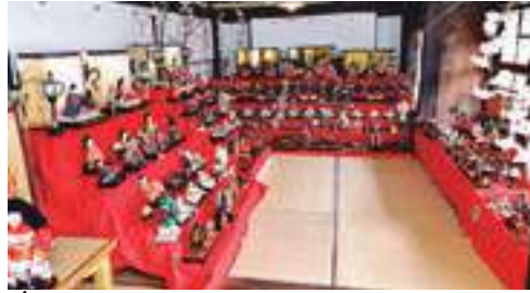
2月下旬～3月下旬(期間中の土・日・祝) 長崎街道松原宿ひなまつり