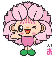
大村市マスコットキャラクター おむらちゃん