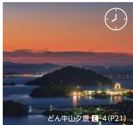
どん牛山夕景 E-4 (P21)