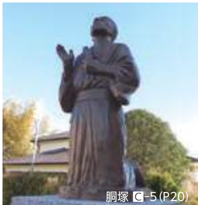
胴塚 ㊦-5 (P20)