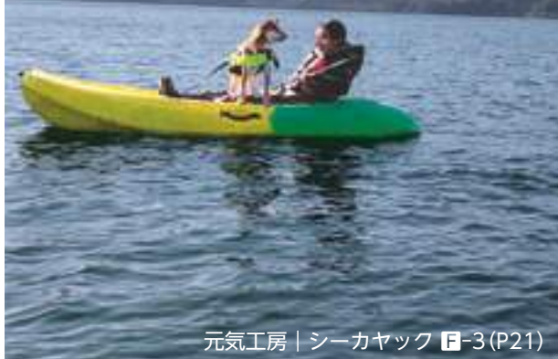
元氣工房 | シーカヤック E-3 (P21)