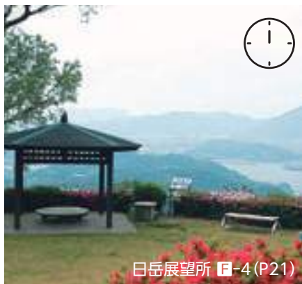
日岳展望所 F-4 (P21)