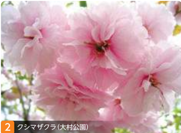
2 クシマザクラ(大村公園)