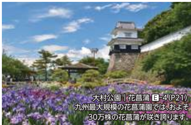
大村公園 | 花萼蒲 E-4 (P21) 九州最大規模の花萼蒲園では、およそ 30万株の花萼蒲が咲き誇ります。