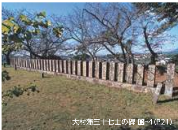
大村藩三十七士の碑 ㊦-4 (P21)

日本近代医学の祖「長与専斎」、衆議院議長「楠本正隆」、世界的物理学者「長岡半太郎」、近代歴史学者の祖「黒板勝美」、明治維新達成に活躍した「渡辺清」ら大村藩勤王三十七士、女性教育と知的障がい者福祉の先駆者「石井筆子」らを輩出しました。