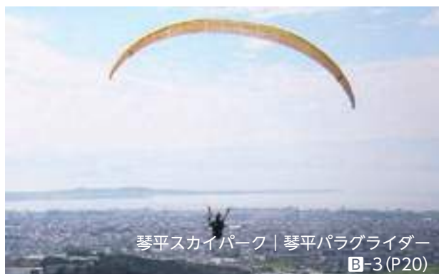
琴平スカイパーク | 琴平パラグライダー E-3 (P20)