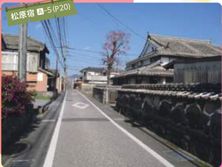
長崎街道の宿場で、ここには本陣や脇本陣はなく、宿場の中央部にある八幡神社の門前に酒屋を兼ねた茶屋が建てられ、諸大名が通行する時の小休憩場所にあてられました。