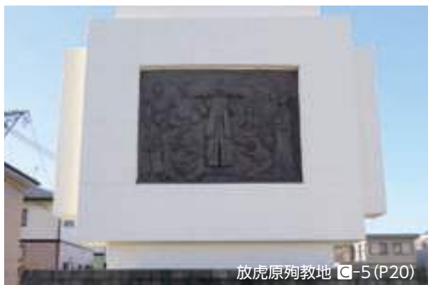
放虎原殉教地 ㊦-5 (P20)