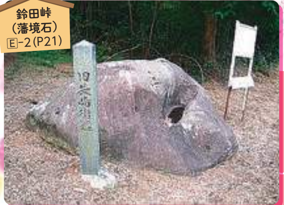
鈴田峠 (藩境石) E-2 (P21)

大村領と諫早領との境の峠で、当時の景観が良く残っている箇所として、文化庁歴史の道百選に選ばれています。