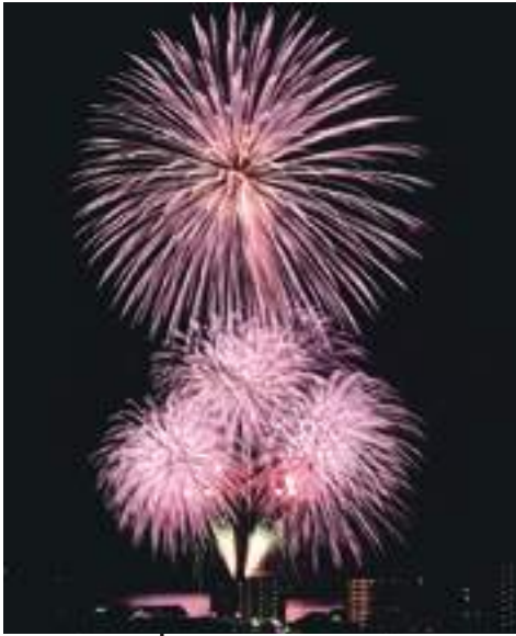
8月1日 おおむら花火大会