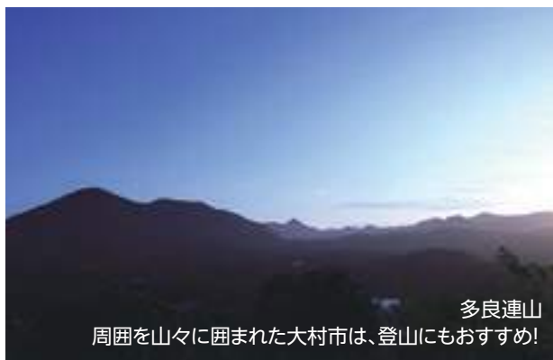
多良連山 周囲を山々に囲まれた大村市は、登山にもおすすめ!