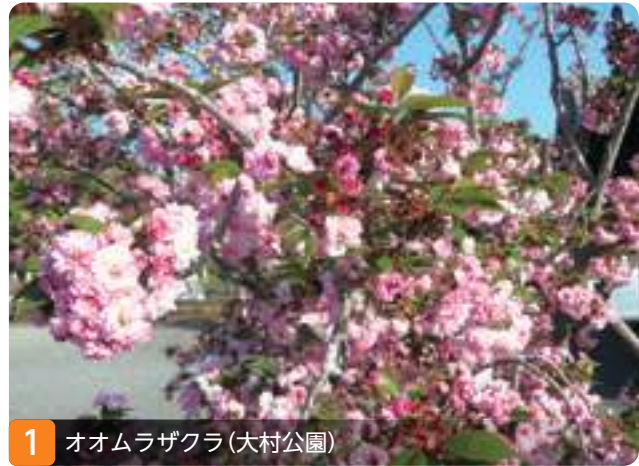
1 オオムラザクラ(大村公園)

八重桜を二つに重ねたかっこうの独特の二段咲きをして、花の外側にあるがく片の数は、10枚(普通の桜は5枚)で、花卉の総数は、少ないもので60枚、多いものでは200枚にも達するなどの特徴があり、ピンク色の優美なことでも有名です。昭和47年4月8日に市の花として決定しました。