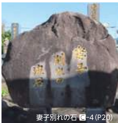
妻子別れの石 ㊦-4 (P20)