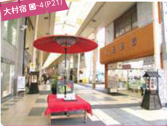
大村宿 D-4 (P21)

長崎街道の宿場で、大村藩2万7000石の城下町にあり、旅籠や芝居小屋、一杯飲み屋などがあり宿場町として栄えていました。