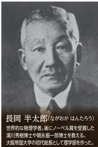
長岡 半太郎 (ながおか はんたろう)

東京の芝公園をはじめ日本の数多くの都市公園などの設計に尽力。卓越した技術により明治・大正期の造園界をリードした。