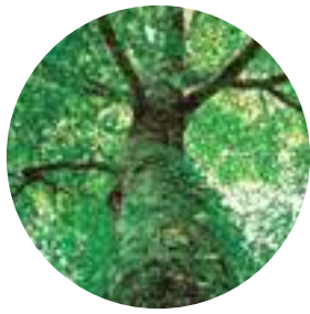
市の木◎イチイガシ

常緑高木で樹皮は暗褐色または灰褐色で、小柄はよく分岐し、葉は有柄で互生し、やや枝端に集まり、先はとがり、もとは鋭形で縁辺の上部に短芒に終わる鋭鋸歯があります。雄花穂は新枝の下部より下垂し、雌花穂は新枝の上部の葉のつけねに生じます。5月頃に開花し、当年の10月～11月ごろ堅果成熟を迎えます。平成元年6月1日に市の木として決定しました。