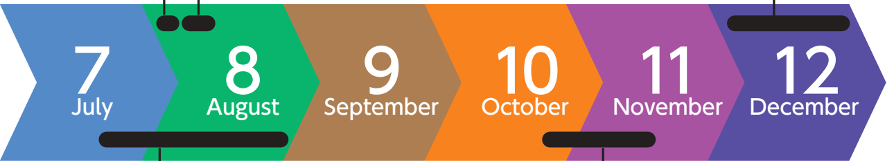
7月~8月 松原海水浴場