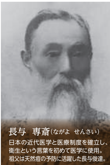
長与 専齋 (ながよ せんさい)

大村藩勤王三十七士の思想的中心で、五教館では校長を務めた人物。慶応3年(1867)正月に上小路の自宅前で何者かにより暗殺。