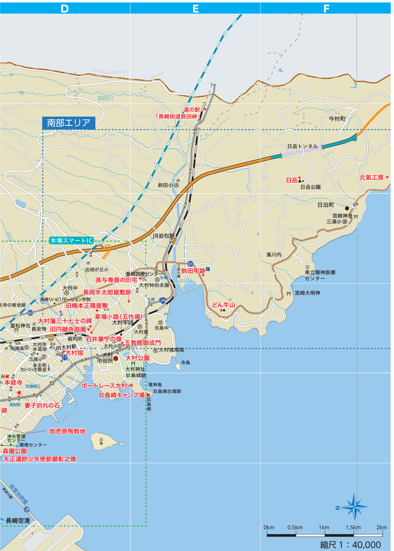
縮尺 1 : 40,000