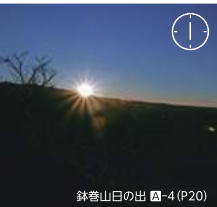
鉢巻山日の出 A-4 (P20)