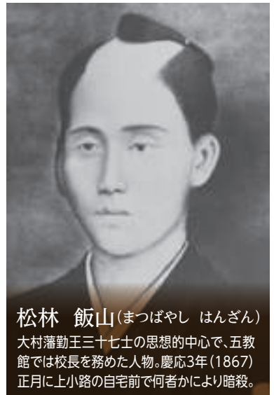
松林 飯山 (まつばやし はんざん)

大村藩勤王三十七士として明治維新に活躍した剣の達人。各藩が一つにまとまり助けて行動しようと「一繩の策」を計画。