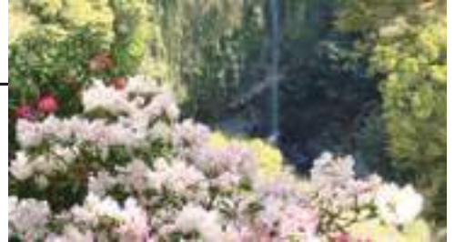
3月～4月 しゃくなげ祭り