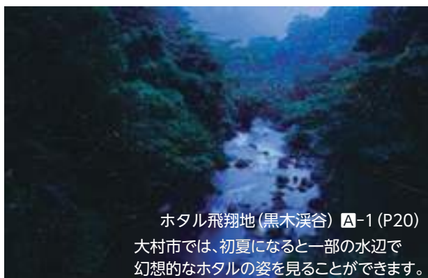
ホテル飛翔地(黒木渓谷) A-1 (P20) 大村市では、初夏になると一部の水辺で 幻想的なホテルの姿を見ることができます。