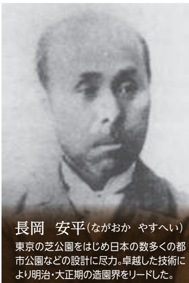
長岡 安平 (ながおか やすへい)

明治5年(1872)生まれ。近代日本画壇を率いた人物。横山大観らと並び称される日本画会幹事。