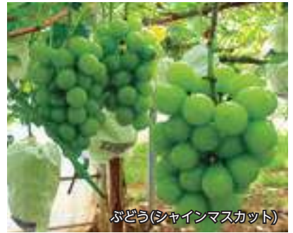
ぶどう(シャインマスカット)