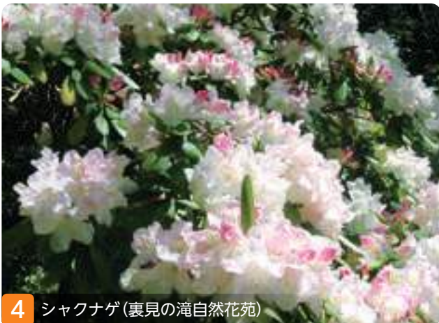
4 シャクナゲ(裏見の滝自然花苑)