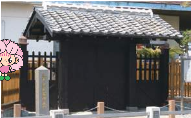
五教館御成門(県指定史跡) ㊦-4 (P21)

ここ、大村藩の文人や武人の 足跡は日本の近代史に多くの 偉業と記憶を残しました。