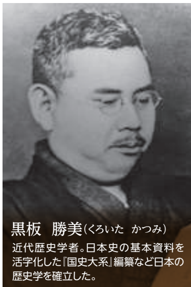
黒板 勝美 (くろいた かつみ)