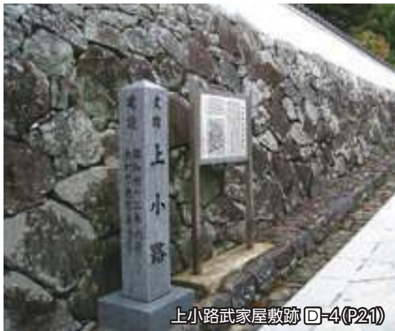
上小路武家屋敷跡 ㊦-4(P21)