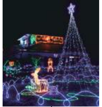
冬季 イルミネーション