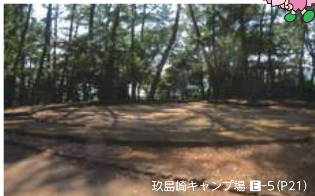
玖島崎キャンプ場 E-5 (P21)

大村ではたくさんの体験ができます。 フルーツ狩りやアクティビティなど、 大村で思い出に残る体験を！