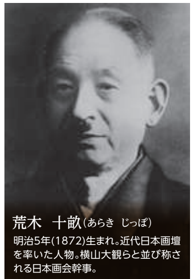
荒木 十畝 (あらかき じっぽ)

近代歴史学者。日本史の基本資料を活字化した『国史大系』編纂など日本の歴史学を確立した。