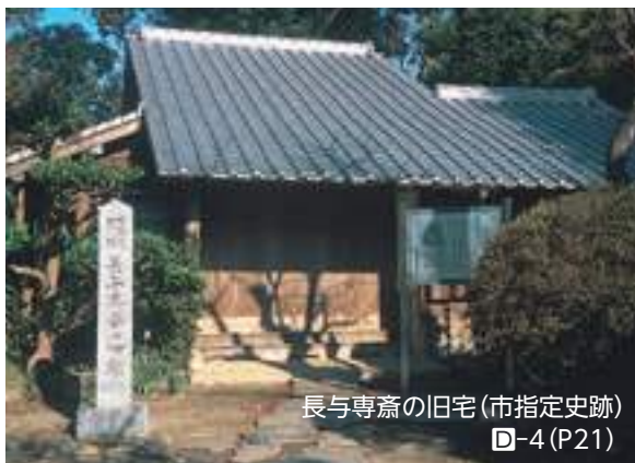
長与専斎の旧宅(市指定史跡) ㊦-4 (P21)