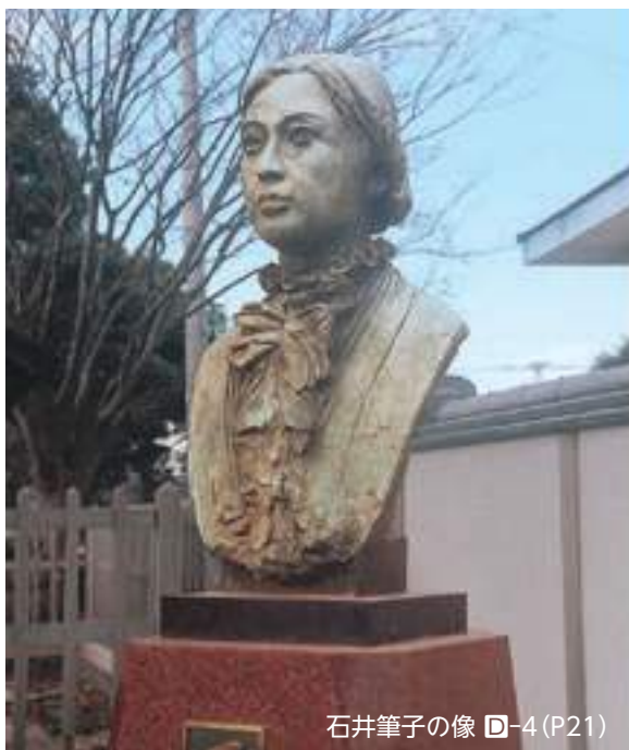
石井筆子の像 ㊦-4 (P21)