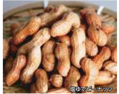
塩ゆでピーナッツ