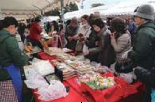
2月11日 長崎街道 大村藩宿場まつり