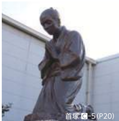
首塚 ㊦-5 (P20)