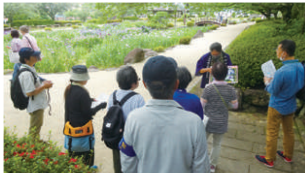
花菖蒲さるく 6月10日(土)